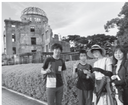
2024年 ピースアクション in ヒロシマ 参加者のみなさん

コープみえの平和活動は、組合員のみなさんからのカンパで支えられています。 今年度は、「牛乳パックで作るうごく第五福竜丸」企画や ピースアクションinヒロシマ・ナガサキでカンパの一部を使用しました。