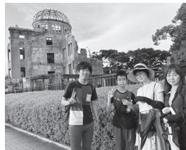
2024年ピースアクション in ヒロシマ 参加者のみなさん

コープみえの平和活動は、組合員のみなさんからのカンパで支えられています。今年度は、「牛乳パックで作るうごく第五福竜丸」企画やピースアクションinヒロシマ・ナガサキでカンパの一部を使用しました。