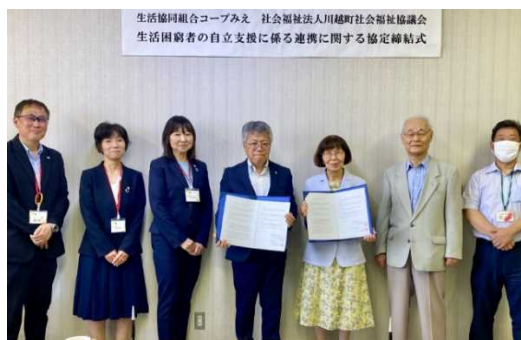
7/5、川越町との協定締結式の様子。

内容: 組合員の注文間違え商品など、センターで発生したキャンセル商品(良品返品商品)を社会福祉協議会通じ、生活困窮者へ提供します。