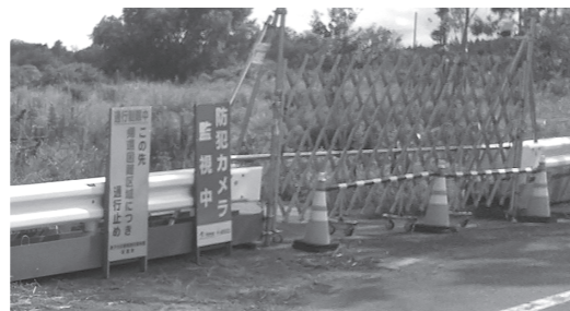
帰宅困難地域では、道に鉄の柵が取り付けられ、たとえ自分の土地でも自由に入れません

福島では、未だに放射性物質と闘い帰宅困難の地域があるということ親子で学ぶことや、福島の方と接することができ、非常に貴重な経験で忘れられない夏になりました。この経験を一人でも多くの方にお伝えし、少しでも福島の復興や応援につなげていけたらと思います。(組合員の感想)