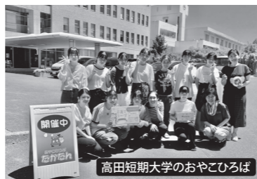
高田短期大学のおやこひろば