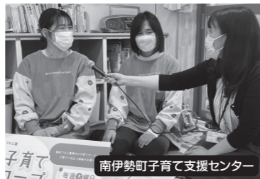
南伊勢町子育て支援センター