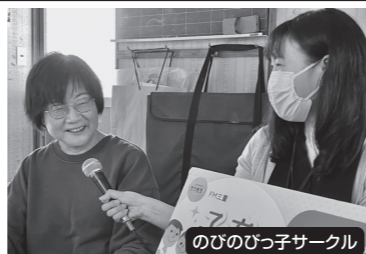
のびのびっ子サークル