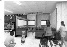
▲交流スペース完成イメージ図