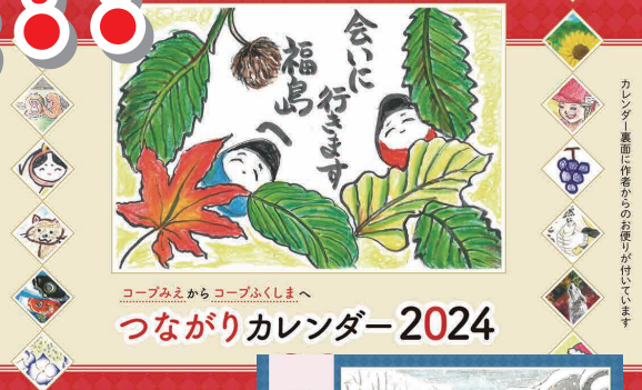
つながりカレンダー2024

みなさんのイラスト作品を載せた「つながりカレンダー」で福島に想いを届けませんか。