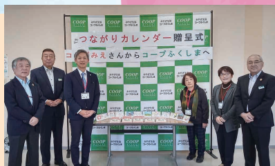
昨年のお届け時の様子

コープふくしまへ カレンダー1,000部と、 全応募作品を冊子にして お届けします。